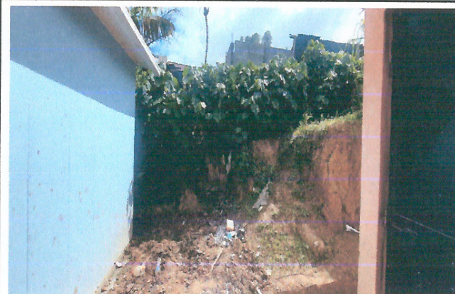
Foto 4: Mejoramiento e instalación de estructura de lavado de manos con su tinaco y base respectiva.

Observación: Si es necesario se pueden agregar hojas adicionales y actualizar el número de hojas.