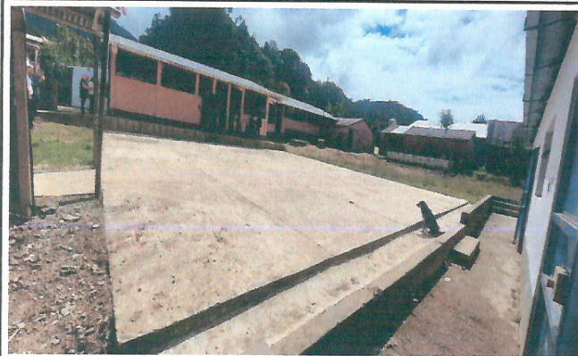
Foto 1: Mejoramiento de estructura tipo pórtico e instalación de lámina troquelada calibre 26, en patio 1